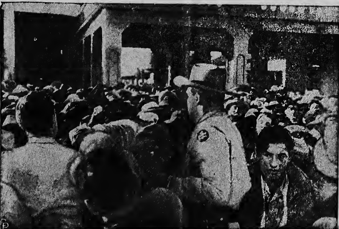
De laatste dagen worden herhaaldelijk stormaanvallen gedaan op de Amerikaans-Mexicaanse grens, door arbeiders, die gewend waren elk jaar als seizoenarbeiders naar Californië te trekken. In verband met toenemende werkloosheid hebben de Verenigde Staten dit verkeer van seizoenarbeiders vrij onverwacht geheel lamgelegd.

Omgeeft Uw huid met de geur waar mannen van houden.